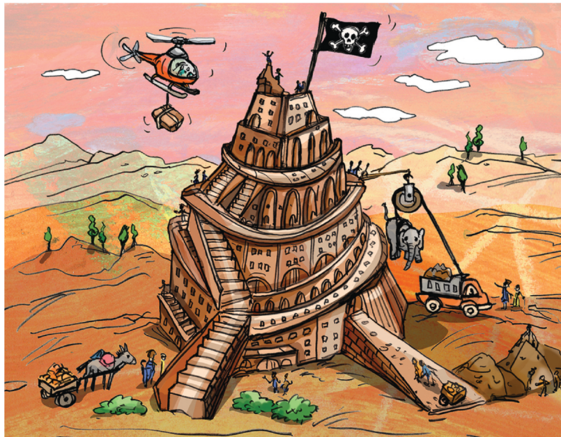
Lösung: Hubschrauber, Piratenfahne, Lastwagen, Elefant

Eine Geschichte, mit der sich die Menschen früher zu erklären versuchten, warum sie alle verschiedenen Sprachen sprechen. Und die uns erzählt, dass es nicht richtig ist, wenn Menschen wie Gott sein wollen. Ein Fehler. Findet ihr auch die vier anderen Fehler im Bild?